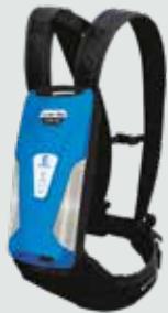
LI-ION 700 14 Ah - 50,4 V