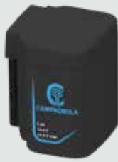
EP1450 5 Ah - 14,4 V