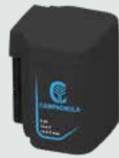
EP2150 5 Ah - 21,6 V