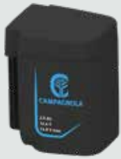
EP1425 2,5 Ah - 14,4 V