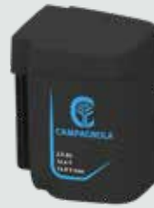
EP2125 2,5 Ah - 21,6 V